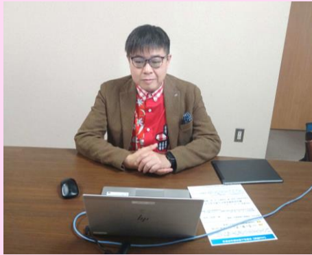
畑地が「難治性咳嗽を診たら考えること」について講演しました。